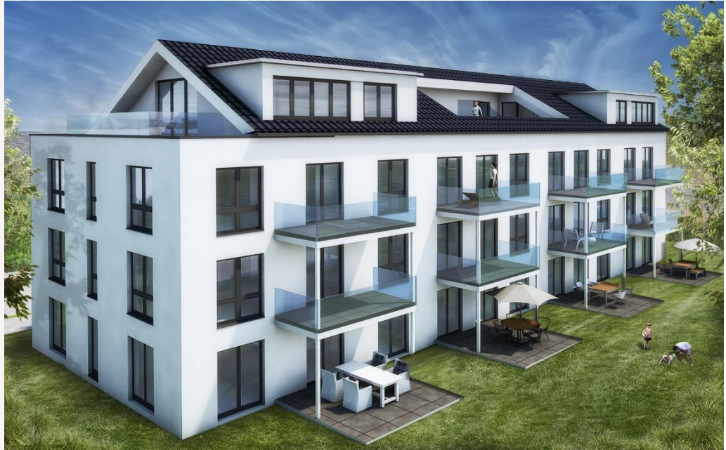
Musterdarstellung – Details können abweichen.

Lassen Sie sich von diesem Neubauprojekt begeistern!