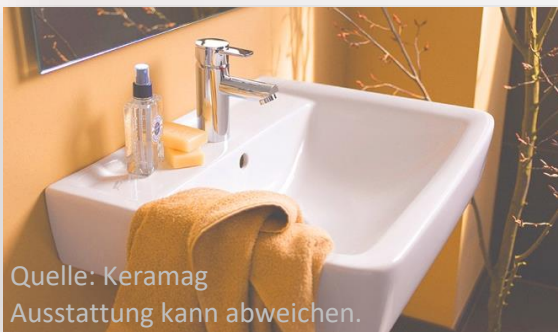
Ausstattung kann abweichen.

Wohnen & Leben in der Huchtstraße fängt mit den äußeren Werten an. Moderne Gradlinigkeit bestimmt das Erscheinungsbild des Objektes. Die angenehme Farbwahl vermittelt wohnlichen Charakter. Durch die Verwendung von hochwertigen Materialien entsteht ein exklusives Wohnerlebnis.